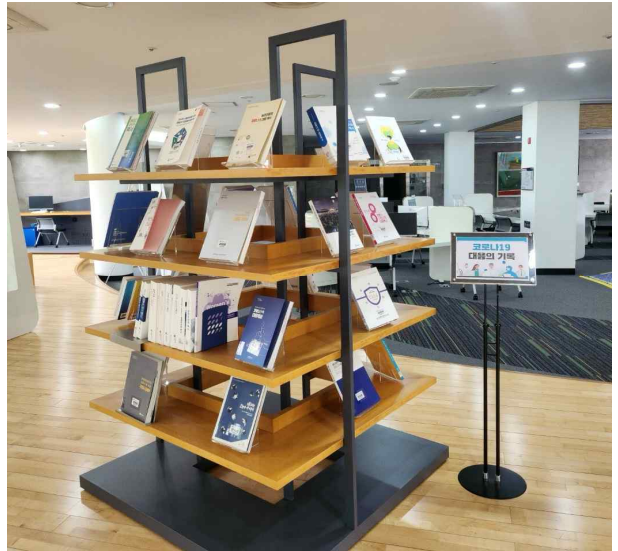
코로나19 대응기록 비치 사진