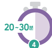
4 접종 후 의료기관에서 20~30분 머무르며 이상반응 관찰 후 귀가