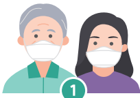
1 보호자와 대상자 모두 마스크 착용