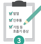
3 대상자, 보호자는 코로나19 증상이 있을 시 내원 전 알리기