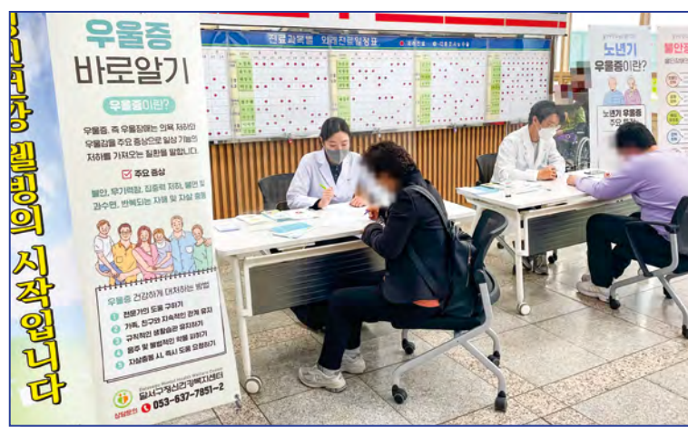
정신건강 이동상담 행사(부스 설치 및 상담)