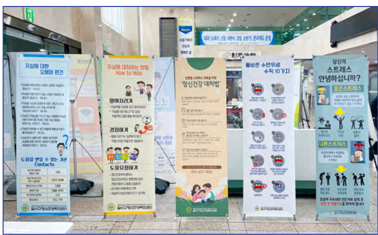
정신건강 관련 자료 전시