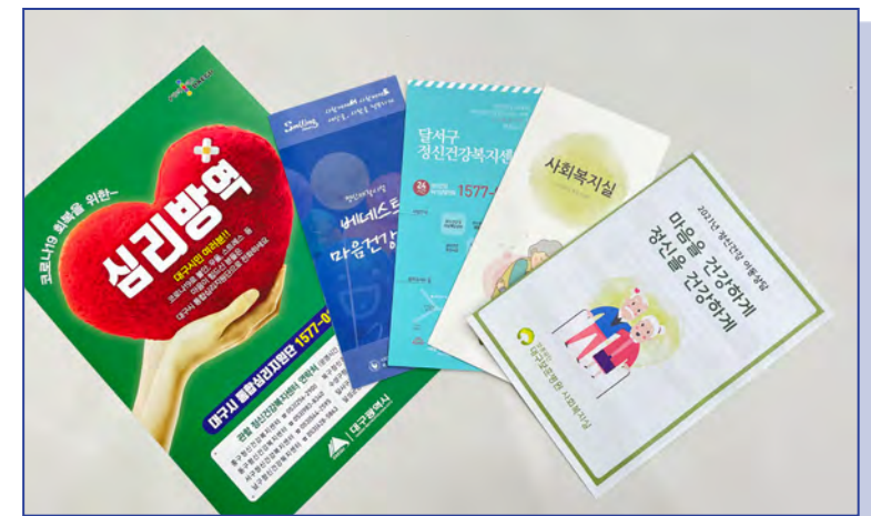
정신건강 관련 리플릿 제작 및 배부