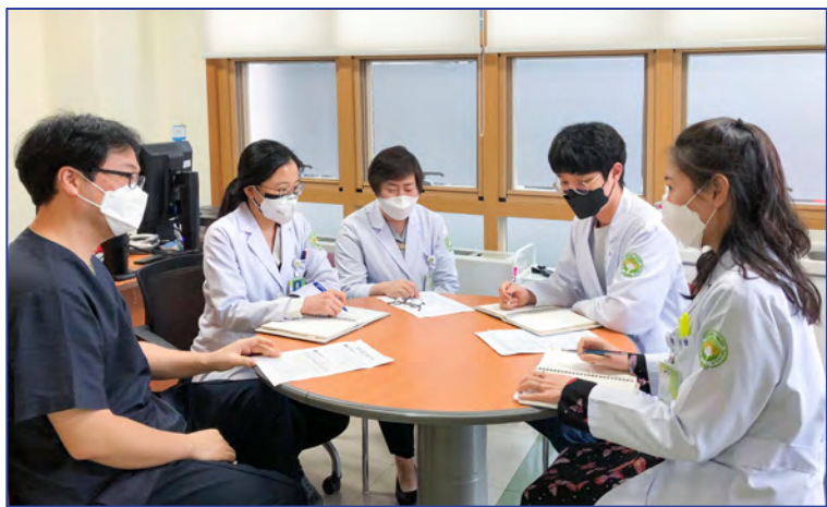
자살 고위험군 사례관리팀(자살예방팀) 회의

한국보훈복지의료공단 대구보훈병원에서는 원내 의사부터 간호사, 사회복지사, 임상심리사 등 여러 분야의 전문가들로 구성된 자살예방팀 을 운영 중입니다 지역사회 정신건강 관련 전문기관들과 협력체계를 구축해 시민들의 다양한 정신건강문제(자살생각, 우울 등) 예방 및 악화 방지를 위한 맞춤형 서비스를 제공합니다