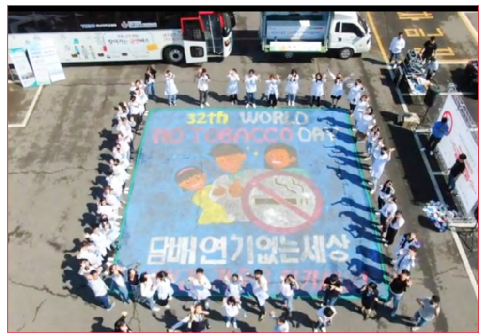
세계금연의 날 행사