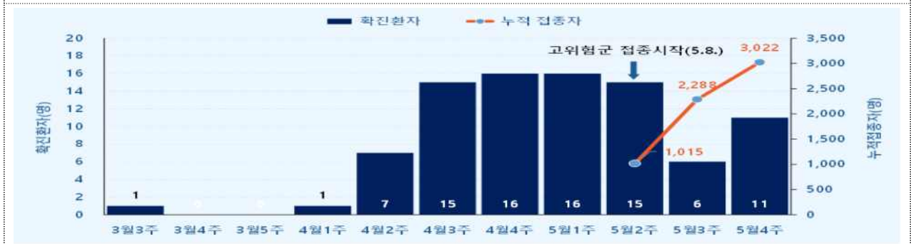
< 확진환자 발생 및 예방접종자(5.8일 이후 기준)>

올해 3월 첫 확진환자가 발생한 이후 약 4주간 두자리수로 증가하던 확진환자가 5월 3주 감소 후 4주에는 소폭 증가하였으며, 고위험군 대상 노출 전 예방접종자수는 지속적으로 증가하고 있다.