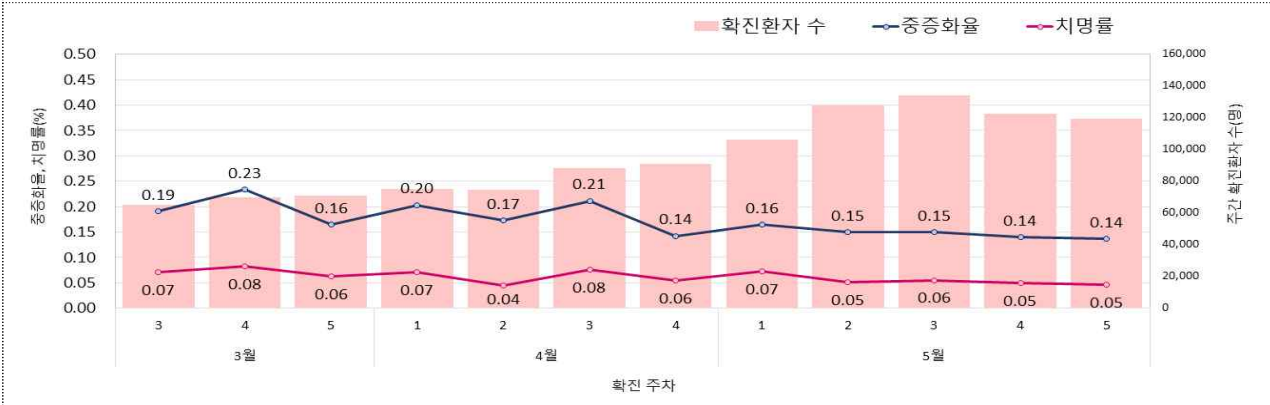
<주간 위중증 환자 및 사망자 발생 현황('23.6.17. 0시 기준)>

'23년 6월 17일 기준, 전체 인구 10만 명당 코로나19 누적 사망률은 67.7명(치명률 0.11%)이며, 연령대가 높을수록 사망률과 치명률이 높았다.