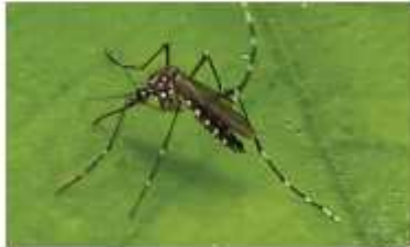
〈이집트숲모기〉 열대·아열대 지역 도시에서 주로 서식