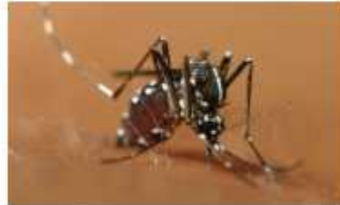
〈흰줄숲모기〉 북미, 유럽, 아시아 산림지역에서 주로 서식