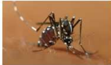
〈흰줄숲모기〉 북미, 유럽, 아시아 산림지역에서 주로 서식