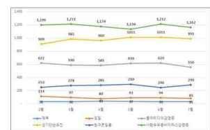
그림 2 성매개감염병 월별 발생신고 현황