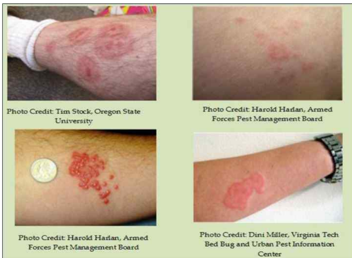
그림 7. 빈대 물림 증상 [19]