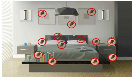
그림 12. 빈대의 주요 서식지

○ 빈대는 주로 야간에 수면 중인 사람을 흡혈하기 때문에 침대 등 사람이 잠을 자는 위치와 가까운 곳에 주로 서식