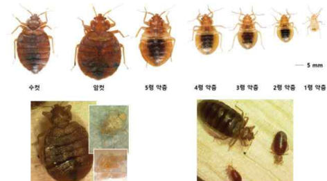
<빈대 모습>[26] <빈대가 흡혈한 모습>[26] 그림 15. 빈대의 모습 [3]

- 성충은 적갈색에 납작하며 5-6 mm 정도, 약충은 성충에 비해 더 작고 옅은 색깔임