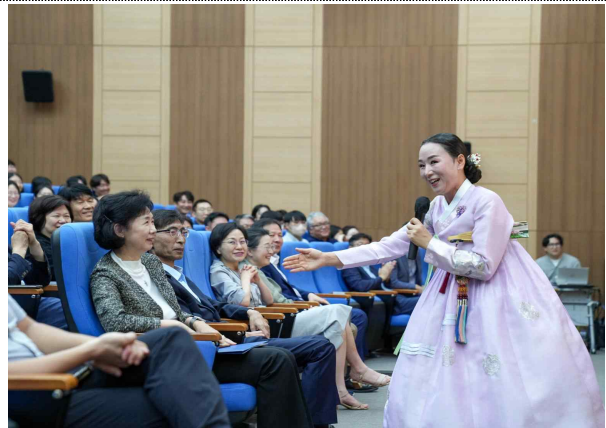
< 청렴라이브 >