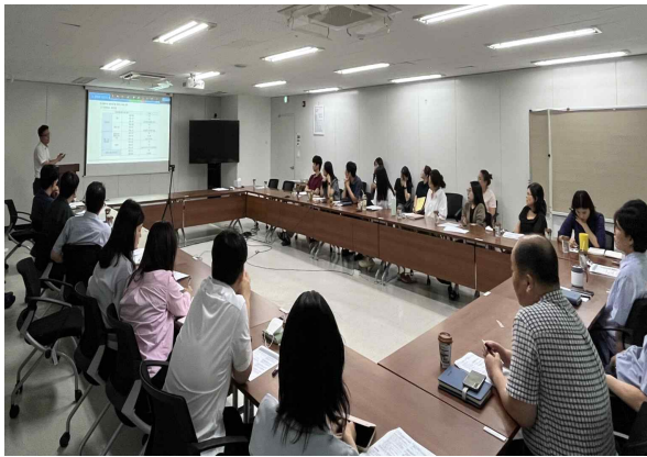
< 찾아가는 청렴컨설팅 >

또한, 찾아가는 청렴 컨설팅 및 전 직원이 참여하는 각종 청렴 홍보 캠페인(청렴 라이브, 소식지, 청렴 퀴즈, 공모전, 모의신고 등) 등을 통해 직장 내 반부패·청렴 문화를 조성하였다.