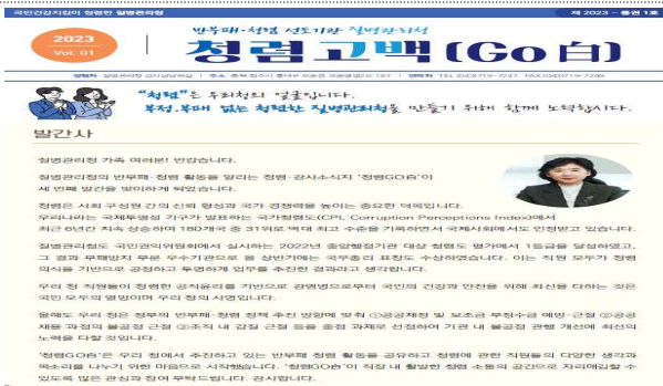
< 청렴소식지 '청렴Go白' >