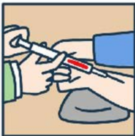
C형간염 검진 받기