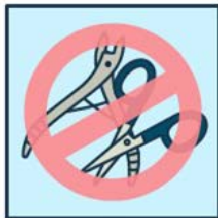
위생도구 공동사용 금지