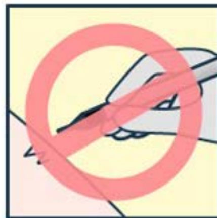
비위생적인 시술 금지