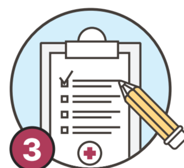
3 대상자, 보호자는 코로나19 증상 있을 시 방문 전 알리기