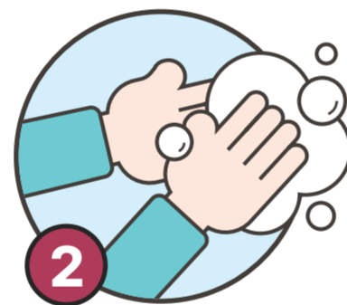
2 손소독 등 개인위생 수칙 준수