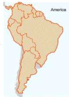
Quarantinable Disease Risk Areas

Korea Centers for Disease Control and Prevention site ▶ http://www.cdc.go.kr