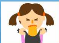
구토 및 설사