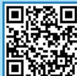
구토 시 소독법